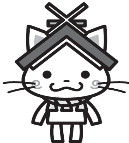
島根県観光キャラクター「しまねっこ」 使用許諾第6725号